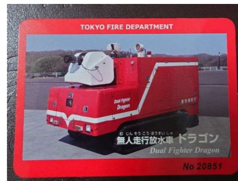
本所防災館体験記念品