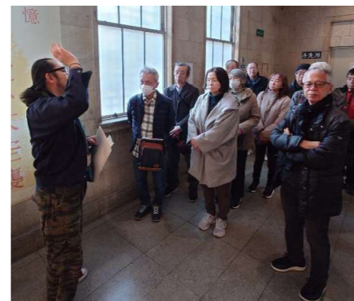
東京都復興記念館