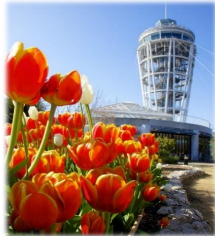
江の島サムエル・コッキング苑