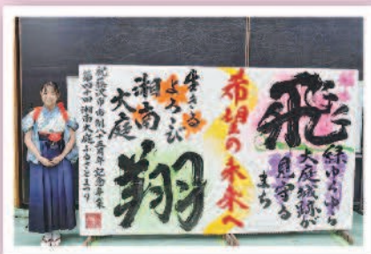
書道パフォーマンス 書道家 荒井 理紗子