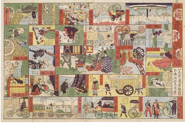
三代歌川広重「流行車尽し廻双禄」

電話またはFAX・Eメールに「絵双六にみる幕末の世界観」、氏名、電話番号を書いて藤澤浮世絵館へ。 午前10時から受付開始。 ※受付開始日は電話が大変混み合います。つながりにくい場合がございますが、ご了承ください。 電話 0466-33-0111・FAX 0466-30-1817・Eメール fj-ukiyo@city.fujisawa.lg.jp