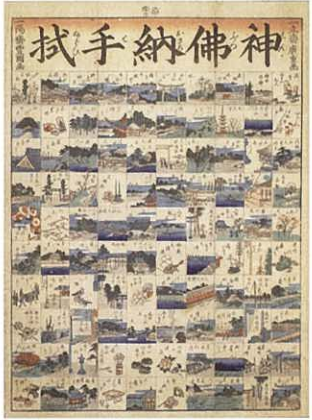
歌川国貞（三代豊国）・歌川広重「神仏納手拭」