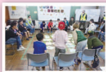
ジャンボかるた大会 湘南大庭地区郷土づくり推進会議