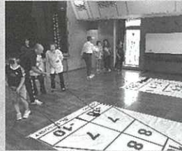
シャッフルボード

爽やかな五月晴れに恵まれた5月11日(日)、今年で3回目となる「ふれあいスポーツを楽しむ会」が御所見地区社会福祉協議会主催のもと、御所見・中里地区社会体育振興協議会と御所見市民センターの共催で開催しました。