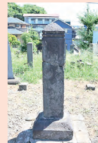
敵御方供養塔(国指定)

一遍上人を宗祖とする時宗の総本山。境内の歴史的建造物のうち、中雀門は市指定。本堂を含む10件は国登録。山内寺院の長生院は、江戸時代に人気のあった小栗判官ゆかりの寺院。