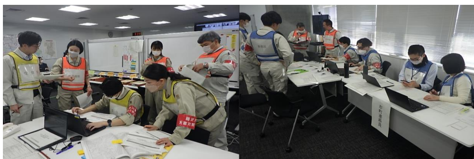
【情報収集・情報発信】