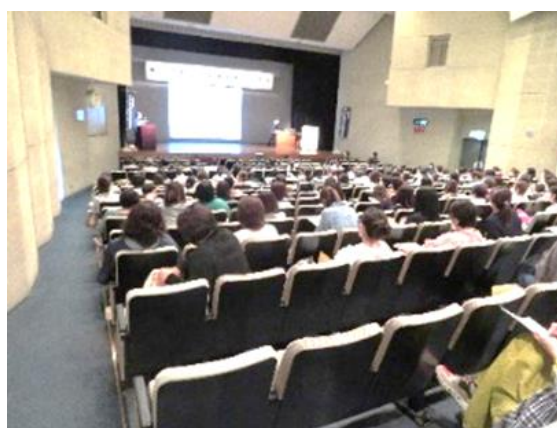
←秩父宮体育館にて レクリエーション研 修（左）と座学の研 修（右）