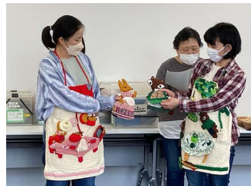
エプロンシアター「お かえし」の実演→

内容：地区での行事等で貸出を行っている紙芝居・パネルシアター等の修理や、缶バッジの作成等を行います。