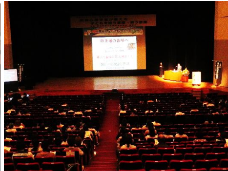
←受付設営をしている様子(左)、講演中(右)