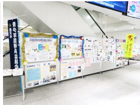
←パネルの掲示作業中(左)、設置完成後(右)