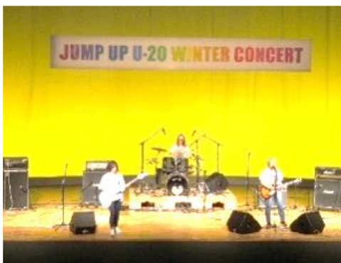
←出演者の会場下見（左）、 本番の演奏中（右）