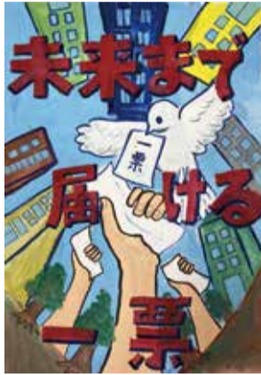
最優秀賞 小学生の部