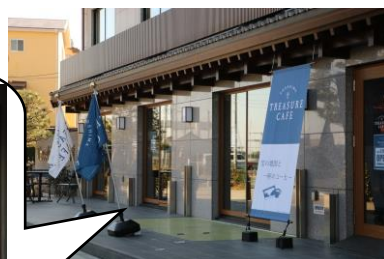
▲ENOSHIMA TREASURE CAFE (定休日：水曜日)