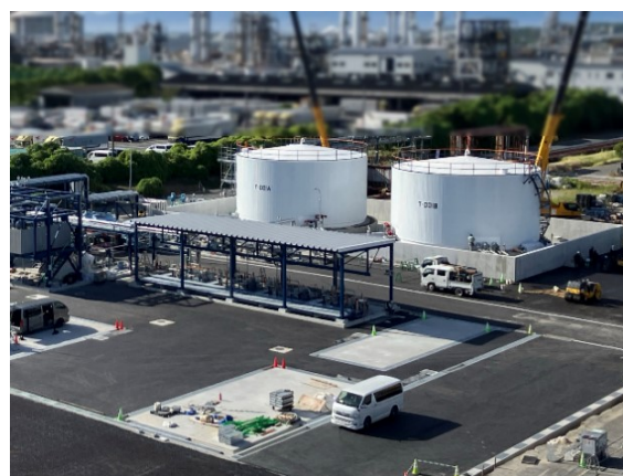
SAF の原料となる廃食用油受け入れ施設