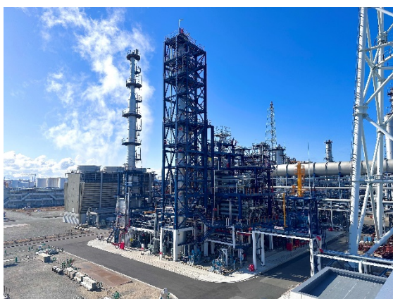
完工した SAF 製造装置

日揮 HD とレポインターナショナルは、コスモ石油株式会社と共同で、国内における廃食用油の収集から SAF の製造・輸送・供給に至るまでのサプライチェーン構築に向けて事業化検討を進め、2022 年に新会社 SAFFAIRE SKY ENERGY を設立しました。24 年 12 月にコスモ石油堺製油所（大阪府堺市）内において SAF 製造装置の建設が完了し、25 年 4 月から SAF の供給も開始しています。供給する SAF は、国際的な持続可能性認証である ISCC CORSIA 認証を取得しています。