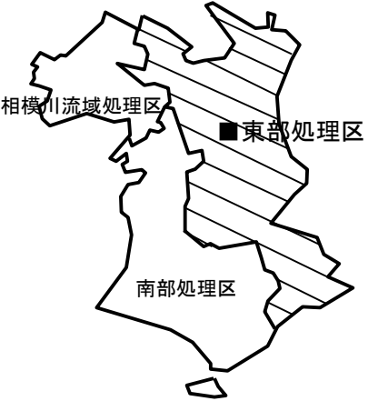
藤沢市処理区分図