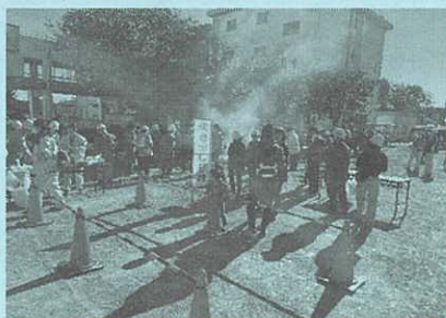
(炊き出し訓練の様子)

ある日突然やってくる大災害、命を守るために何をやるべきか。実際の発災時にまずは冷静沈着な行動を心掛け、防災訓練等で得た知識や経験を生かし自助・共助できるよう切にお願いいたします。