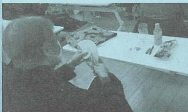
エコランタンづくりの様子