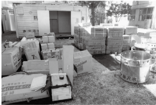
防災備蓄の資機材の最適配置

☆全国特別重点調査に基づく下水道管の工事を着実に推進するとともに下水道施設および管路の耐震化を実施