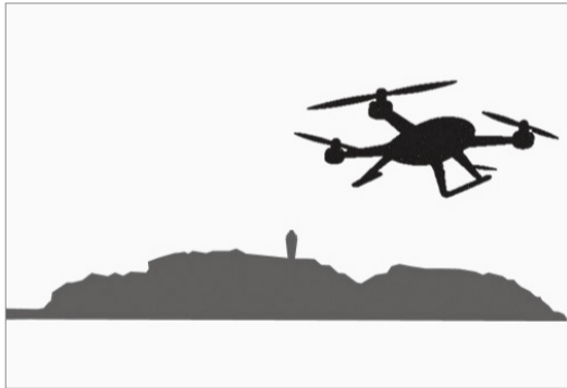
ドローンのイメージ