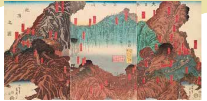
歌川貞秀「大日本富士山絶頂之図」