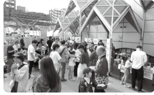
市民センターまつりに出店