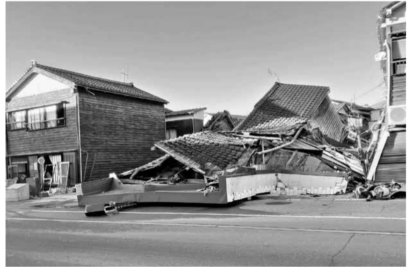
能登半島地震の被害の様子

2000年5月31日以前に建築(築後25年以上が経過)され、耐震診断の結果、耐震性がないと判断された建物です。