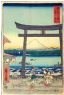
歌川広重 「富士三十六景 相模江之島入口」