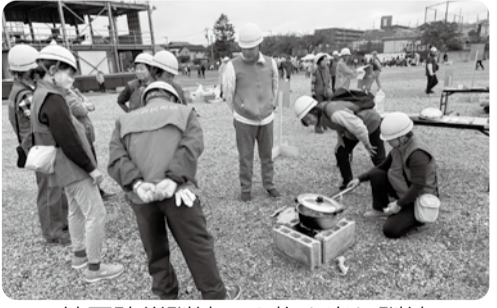
地区防災訓練での炊き出し訓練