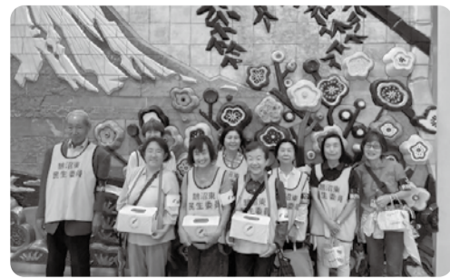
赤い羽根街頭募金への協力

福祉に関する相談や子育てに関する心配ごとなど、地域の民生委員・児童委員にご相談ください。 問い合わせ 福祉総務課 ☎内線3114、☎(50)8441