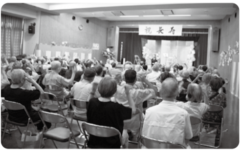
敬老会で長寿をお祝い