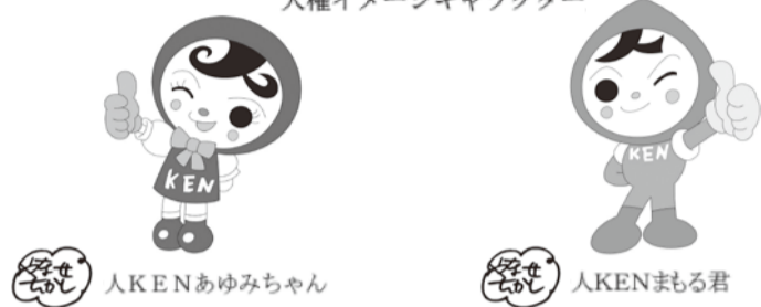
人権イメージキャラクター