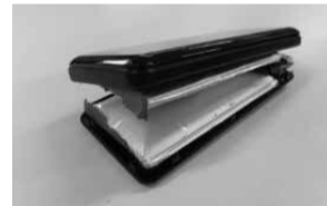
膨張したリチウムイオン電池