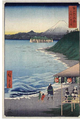
歌川広重 「富士三十六景 相模 七里か浜」