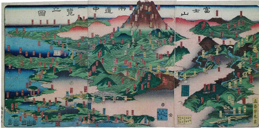
歌川芳虎「富士山両道中一覽之図」

古来から信仰と芸術の対象となった富士山は、浮世絵にも多く描かれました。江の島の遠景に望む富士山の姿は、藤沢の景観にも欠かせません。 本展では、江戸時代末期に大ブームとなった富士講の歴史とともに、歌川広重や歌川貞秀などの絵師たちが描いた多様な富士山を紹介します。浮世絵を通して、藤沢で一足早い富士山の山開きをお楽しみください。