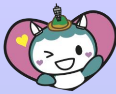
周知活動スケジュール