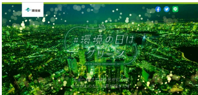
環境省「#環境の日はグリーン」ホームページ

国連で定める「環境の日」に合わせ、市内施設にご協力いただき、環境保全のイメージカラーであるグリーンカラーにライトアップします。