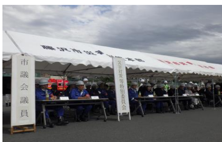
6-1 動員訓練及び災害対策本部設置訓練