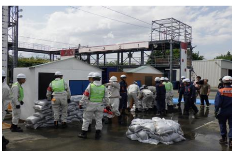
6-2 低地浸水防ぎょ訓練(土のう搬送・積み) 新採用職員