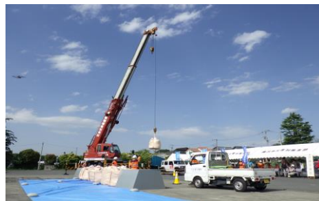
6-7 河川氾濫防止訓練(1t土のう積み) 藤沢市建設業協会