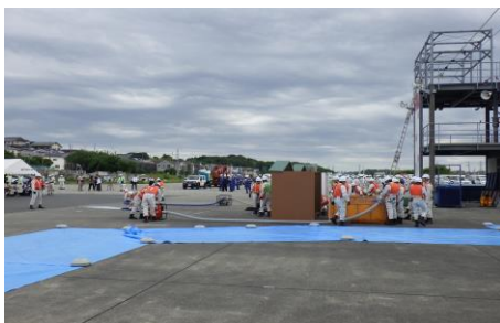
6-5 排水ポンプを活用した内水排除訓練 機動班