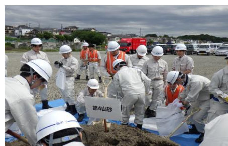
6-2 低地浸水防ぎょ訓練(土のう作成) 新採用職員