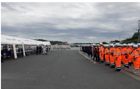
6-1 動員訓練及び災害対策本部設置訓練