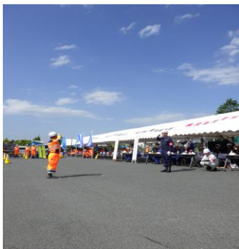
6-7 河川氾濫防止訓練(1t土のう積み) 藤沢市建設業協会