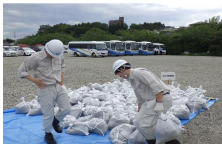
6-2 低地浸水防ぎょ訓練(土のう作成) 新採用職員