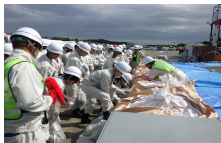
6-2 低地浸水防ぎょ訓練(土のう搬送・積み) 新採用職員