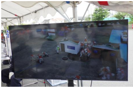
6-3 ドローンによる情報収集訓練 藤沢市建設業協会