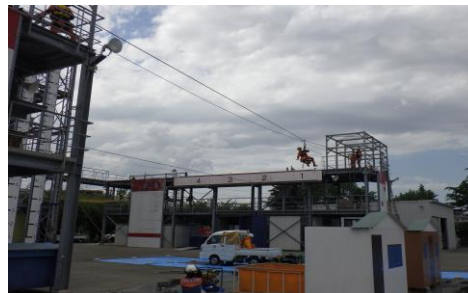
6-6 救出救助訓練 消防局