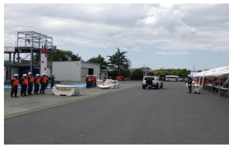
6-4 FRPボート組立訓練 藤沢市消防団