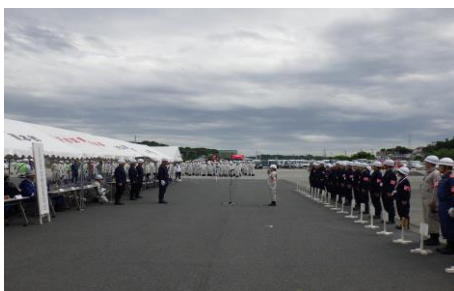
6-1 動員訓練及び災害対策本部設置訓練