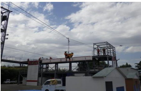
6-6 救出救助訓練 消防局