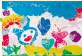
第4回銀賞 「くれよんのしろくんの かくれんぼ」