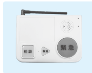
緊急通報装置(固定型)