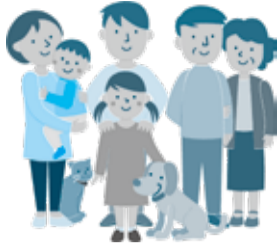
2026年度国民健康保険料率 ( )内は2025年度

※詳細はお問い合わせください 子ども・子育て支援金分について 2026年度から従来の国民健康保険料(医療分・後期高齢者支援金分・介護分)に加えて、新たに「子ども・子育て支援金分」が上乘せられます。 同支援金は児童手当の拡充などの事業に充てられます。