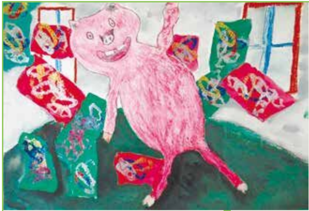
第4回絵本展大賞「よろこびのぶた」