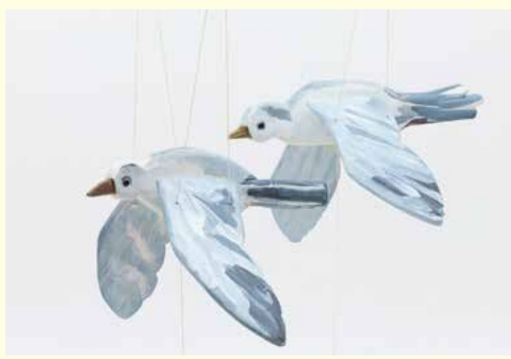
《カモメ》(「ワタリドリにとっての藤沢カルタ」より/武内明子制作) 2026 水性塗料、木

トークセッション(6月13日(土)に開催)などの関連イベントも開催予定です。詳細はアートスペースの㊟へ