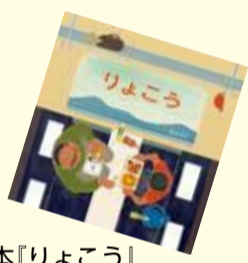
絵本『りょこう』 2025 福音館書店

こうたくんとおじいちゃんの二人旅が描かれており、ページの端々に散りばめられた細かな描写が味わい深い一冊です。