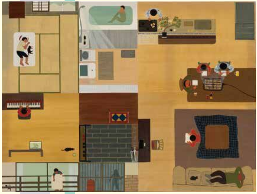
麻生知子《家》2026 油彩、キャンバス