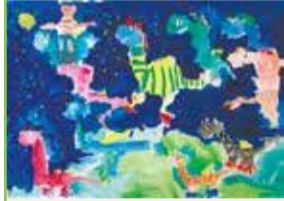
第4回金賞 「エルマーのところにりゅうが ともだちをつれてあそびにきたよ」