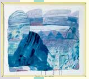
武内明子《波が高い藤沢、穏やかな天草》 2026 アクリル、パステル、コラージュ、紙、木

藤沢での取材が基となり、平面と立体を取り混ぜた46点の作品で構成された「ワタリドリにとっての藤沢カルタ」をはじめ、手彩色絵葉書などを展示します。親しみのある風景やよく訪れる大好きな場所などがアート作品になっているかもしれません。