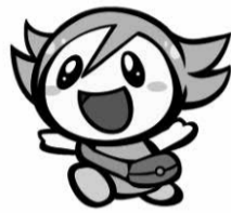
ふじさわ元気バザールシンボルキャラクターふーちゃん