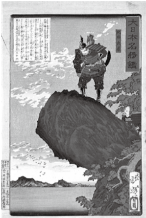
月岡芳年「大日本名將鑑 北條氏康」藤沢市所蔵

⑦は6月27日(土)午前10時～7月18日(土)午後6時30分、①は7月1日(水)午前10時～24日(金)午後6時30分に電話・来館するか、⑦は「10周年記念講演会」、①は「講座②」、氏名・電話番号をファクス・Eメールで藤澤浮世絵館 ☎(33)0111、FAX(30)1817、✉fj-ukiyo@city.fujisawa.lg.jpへ(月曜日を除く午前10時～午後7時(7月7日(火)～17日(金)は午後5時まで))