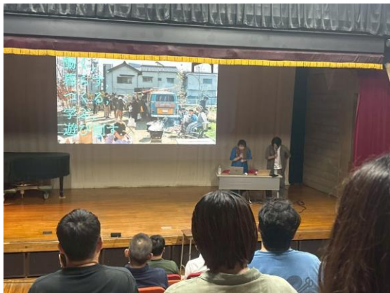
事前講演会の様子

湘南ライフタウンでの暮らしをより楽しく・豊かにするため、自分のまちで何かを始めたい方のエントリーをお待ちしています。