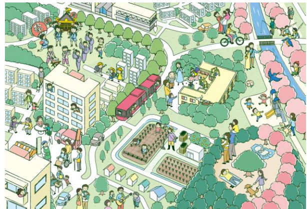
湘南ライフタウン活性化指針より