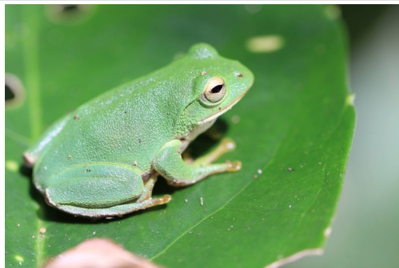
写真 水田を活用している生きもの (シュレーゲルアオガエル)

水田は多くの生きもののすみかであり、人の手で守られることで、多様な命を育んでいます。一度失われると再生が困難なため、豊かな生態系を支える水田の保全は、生物多様性を守る上でとても重要です。