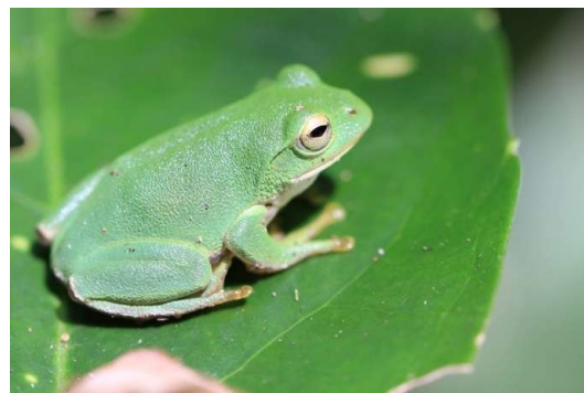
写真 水田を活用している生きもの (シュレーゲルアオガエル)

水田は多くの生きもののすみかであり、人の手で守られることで、多様な命を育てています。一度失われると再生が困難なため、豊かな生態系を支える水田の保全は、生物多様性を守る上でとても重要です。