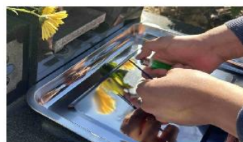
②線香着火時は必ずトレーの上でライター等を使用してください。