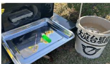
①線香使用時は必ず手桶水を用意し、トレーは香炉の近くで使用してください。