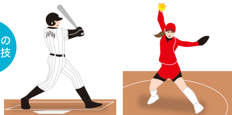
野球/ソフトボール