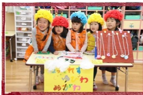
お店やさんごっこ