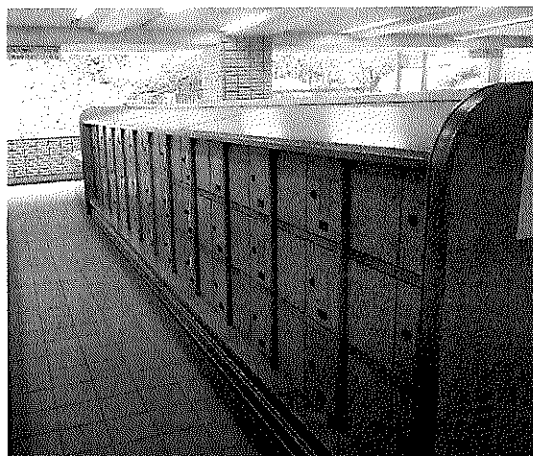
※集合納骨壇の参考写真