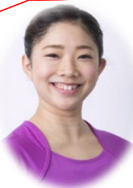
NHKテレビ・ラジオ体操指導者 全国ラジオ体操連盟指導委員