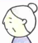
(体が弱り最近家にこもりがちな女性)