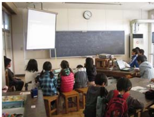
じさくえいがじょうえい 「自作映画上映」