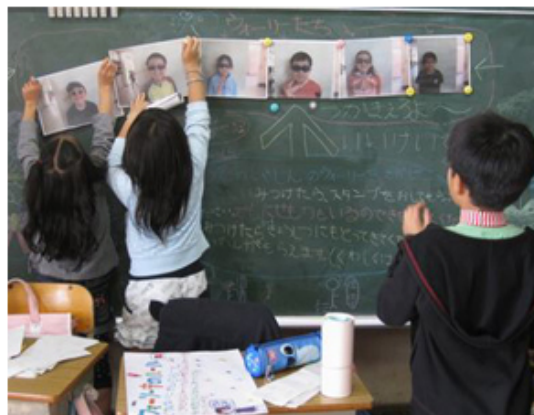
ちゅう 「ウォーリー中」

かく みせ た きゃく よろこ かんが くふう 各クラスごとにお店を出し、お客さんを喜ばせるにはどうしたらよいか考え、工夫をしま す。今年度は11月12日(金)に行われました。お店の内容は、ゲーム、お化け屋敷、 いや やかた にんじゃしゅぎょう やしき じさくえいがじょえい どうじつ がっこうこうかいび 癒しの館、忍者修行の屋敷、マジックショー、自作映画上映などです。当日は学校公開日 になっており、地域の方や保護者の方もたくさん訪れました。