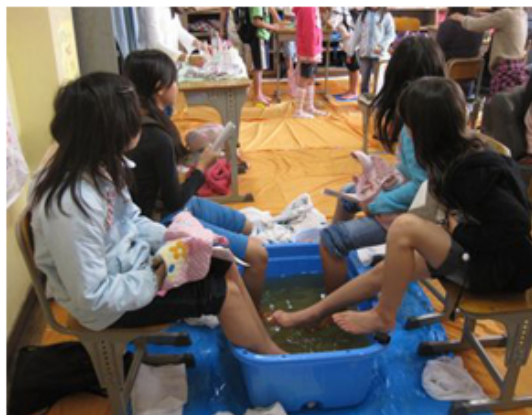
いや やかた 「癒しの館」