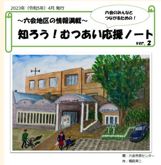
題：六会市民センター 作：堀田英二

六会地区の魅力的な場所・交流の場の情報や、困った時に相談ができる場所などを紹介。