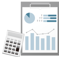
2019年度国民健康保険料率 ( )内は2018年度

いる)方は、届け出により保険料が軽減される場合があります。病気・解雇・災害などの特別な事情によって一時的に保険料が納められなくなった場合は、申請により一定期間保険料を減額・免除できる申請減免制度があります。 ※詳細はお問い合わせください