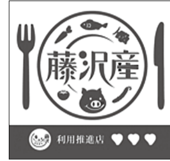
▲目印はこのマークです

藤沢産利用推進店の中でも、特に地産地消に力を入れているお店で、現在27店舗が登録されています。