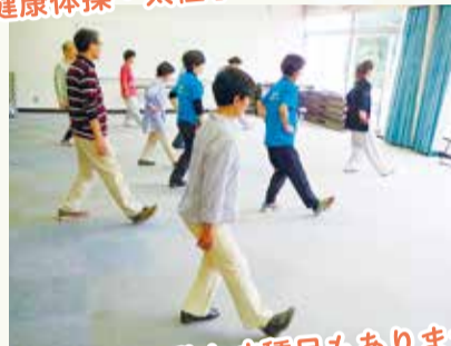
体を動かす種目もあります