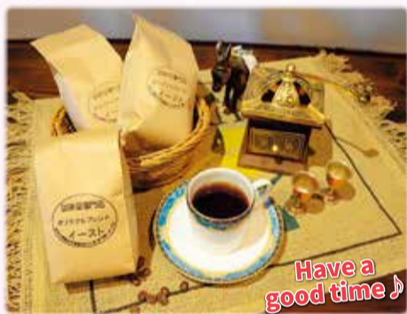
Have a good time!

今回は、珈琲豆専門店イースト(本鶴沼3-12-29、☎(37)1151)のコーヒー豆「イーストオリジナルブレンド」(200g)の引換券を抽選で20人にプレゼントします。