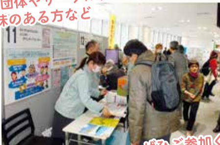
ぜひご参加ください