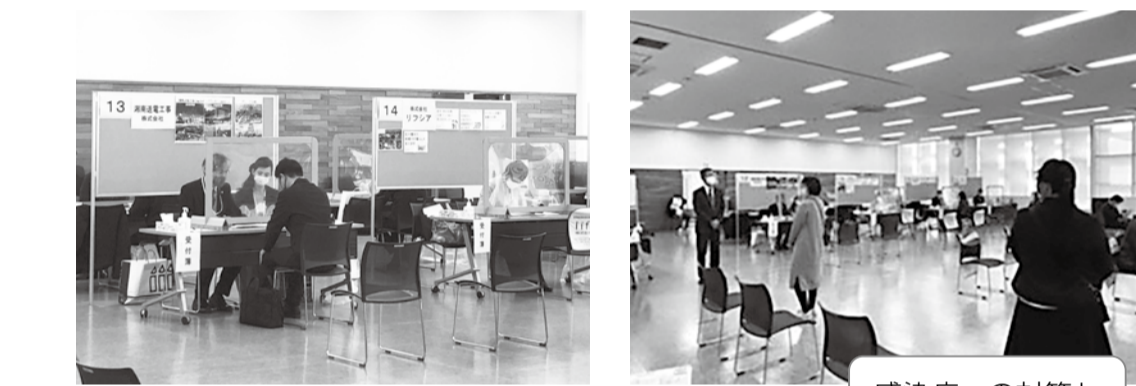
感染症への対策もしています

とき 1月21日(金)午前10時30分～午後1時 ところ 藤沢商工会館ミナパーク 対象 求職中・転職希望の方 ※3月に中学校・高校を卒業見込みの方を除く 持ち物 履歴書複数枚、ハローワーク受付票(公共職業安定所に登録済みの方のみ) 申し込み 当日会場へ 問い合わせ 藤沢公共職業安定所 ☎(23)8609または産業労働課