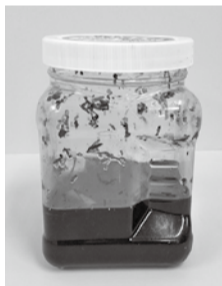
▲数多くの発がん性物質が含まれているタール

加熱式タバコにもニコチンなどの有害物質は含まれるため、喫煙による健康被害は防げません。