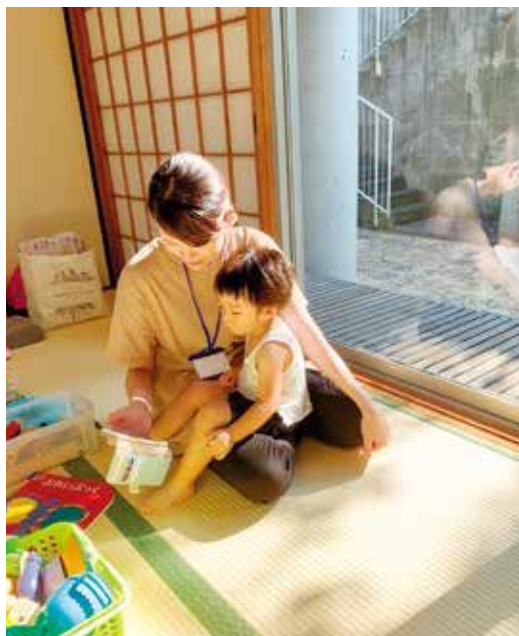
みんなの居場所・れいんぼ〜かふえ 子どもの居場所の実現に向けて、一步を踏み出すワークショップを市と協働で開催。