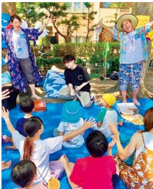
NPO 法人とことこ 幅広い世代が参加できる交流の場や催しで、皆が笑顔になれる機会を提供。