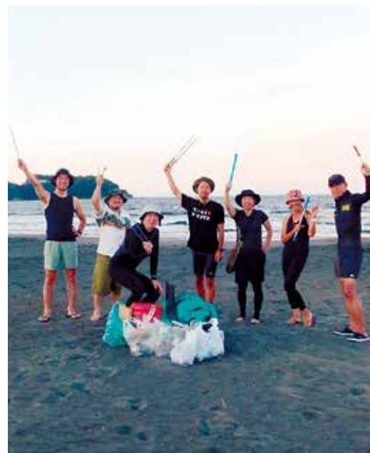
サニーデイサーフクラブ片瀬西浜 サーフィン後や波待ち中にゴミを回収するなど安心安全な海岸を目指して活動。