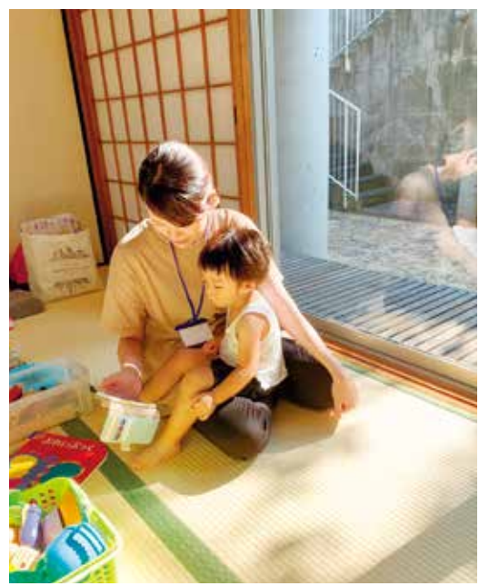
みんなの居場所・れいんぼ〜かふえ 子どもの居場所の実現に向けて、一步を踏み出すワークショップを市と協働で開催。

発行日 毎月10日・25日 編集 藤沢市広報シテプロモーション課 〒251-8601 朝日町1-1 ☎0466(25)1111 ㊚0466(24)5928