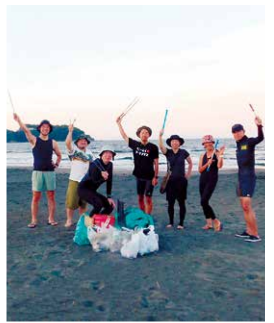
サニーテイサーフクラブ片瀬西浜 サーフィン後や波待ち中にゴミを回収するなど安心安全な海岸を目指して活動。