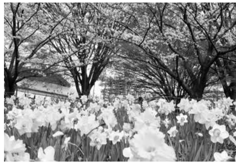
スイセン(さむかわ中央公園)

「美しい花と緑にあふれた住みよいまちづくりを進めていきたい」「次の時代を背負って立つ子ども達に花や木を愛する気持ちを引き継いで広めていってほしい」という願いを込め、1973年に町民からの投票により、町の花としてスイセンが選ばれました。