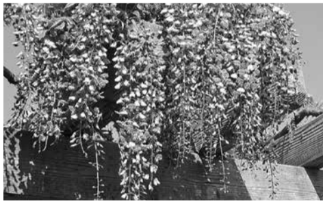
フジ(なかむら公園)