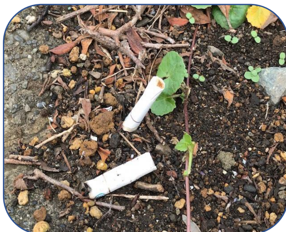
(ポイ捨てされたたばこ)