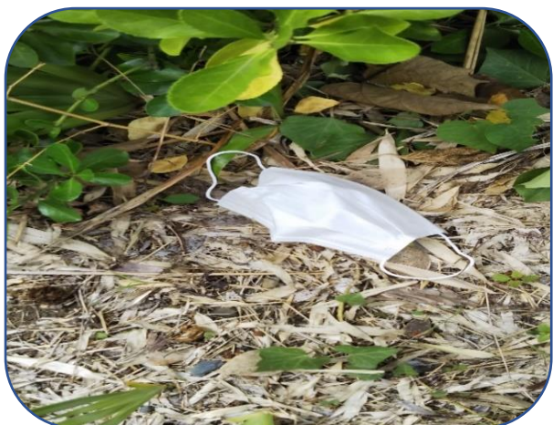
(ポイ捨てされたマスク)